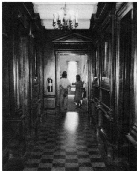
チェンバレン短大の学寮