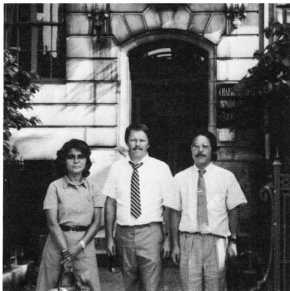
チェンバレン短大の玄関前

この学校は一言で表わせば、専門学校型の私立短大と云える。きわめて歴史が古いにもかかわらず小規模校で、アメリカの私立短大の歴史を一身に表現しているような学校に見える。校舎はイギリス人達が建てたヨーロッパの伝統的なマンションを改造したものである。キャンパスは、街をそのまま借りているという風である。学生数は850人、授業料は寮費を含めて、7000ドル～8000ドルと高い。一般教育以外は文化系の職業コースとインテリアデザイン等、あまり資金のかからない技術系コースを持っている。広報官の説明では、学生募集に知恵をめぐらしている。キャンパスはボストンという環境に在ることが第一であるから、校舎もすべてこの街中の建物を買得ること。寮を確保すること。学校の名を知らしめる広報に最大の工夫をすること。高額の授業料を払える外国人、日本、アラブ等の外国人学生の募集(日本語のパンフレットもある。)アメリカでは私立短大に直接公費援助はないから、学生集めをしなければ成り立っていかない。都会型の職業教育に徹底している感じを与えるものであった。