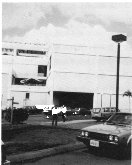
ハワイ大学キャンパス

サマー・セッション（夏期学校）は6週間で一学期分の授業を消化するので、学位にかかわる単位は6単位取得できる。サマー・セッションは12週間（3ヶ月）あるので、12単位まで取れる。サマー・セッションに出る学生は、休学していた人、単位を落した人、早く卒業したい人等の中心になっている。