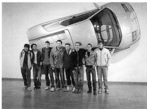
ランボルギーニ本社展示室