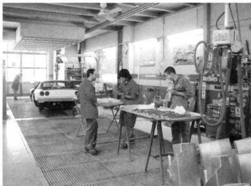
カロツェリア・ザナシーでの研修