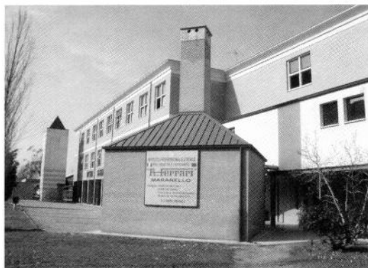
フェラーリ校正面