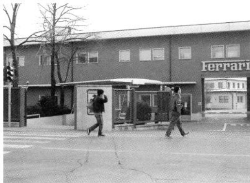
フェラーリ本社工場正門