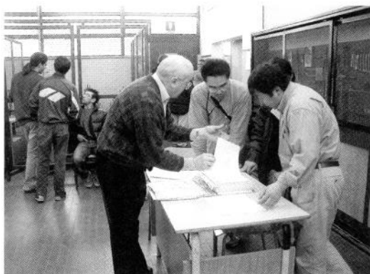
フェラーリ校の実習室（電気配線部門）